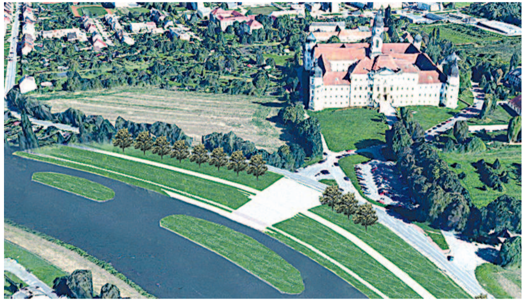
ÚPRAVA ŘEKY MORAVY. Návrhy studentů, jak by měla řeka vypadat v Olomouci.

Cílem každoročně pořádaného workshopu je rozvoj praktických dovedností studentů při zpracování krajinářské studie reálného území a rozvoj jejich kreativity v oblasti krajinářské tvorby. Letos dostaly dva šestičlenné týmy za úkol krajinářsky zpracovat území od mostu v ulici Komenického proti proudu Moravy kolem Hradiska až za hranici intravilánu nad Černošovicemi. Jedná se o území, které spadá do třetí etapy protipovodňových opatření města Olomouce, o němž se nyní jedná a projekčně se začíná připravovat.